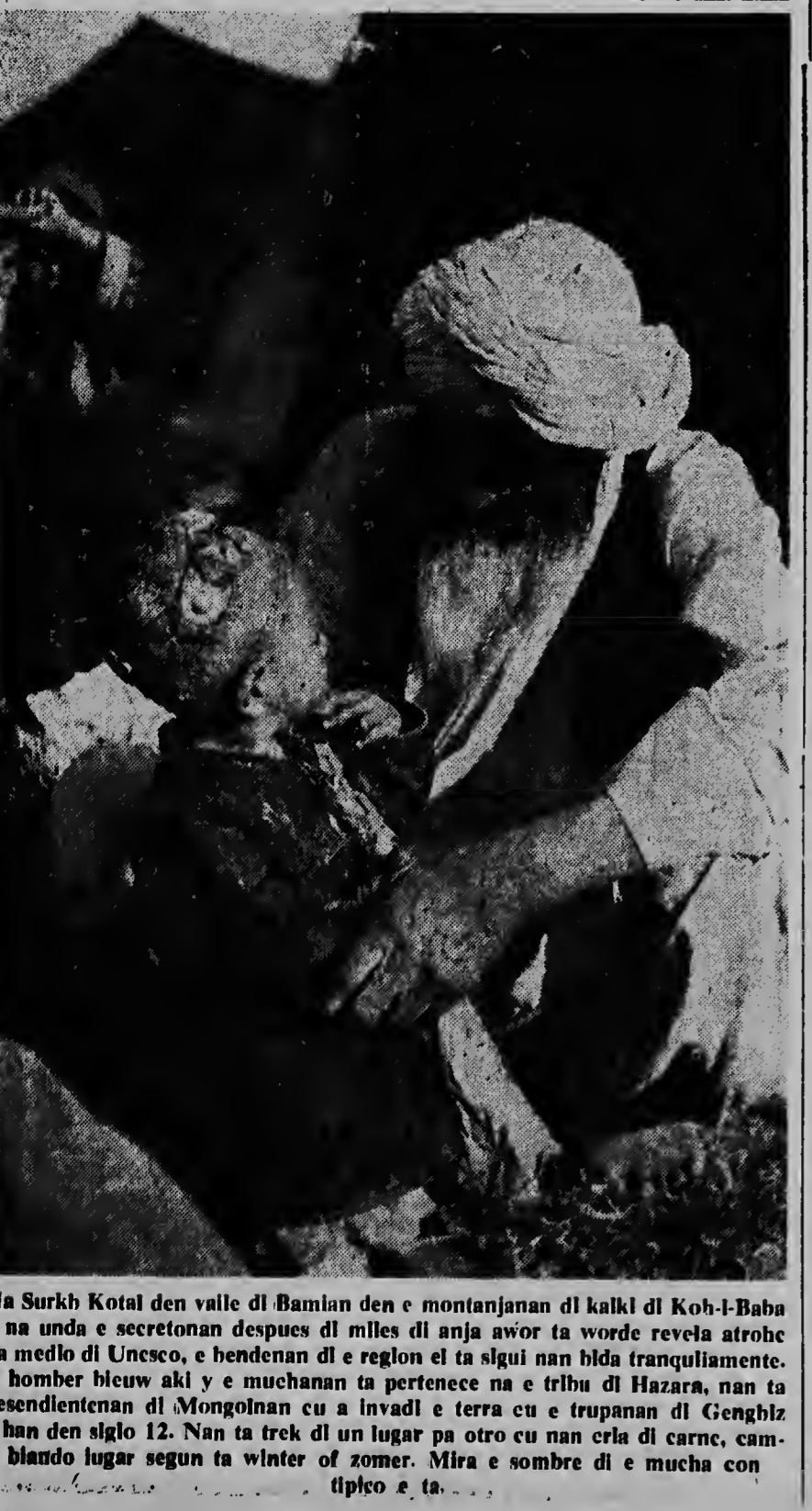
Na Surkh Kotal den valle di Bamian den e montanjanan di kalk di Koh-I-Baba y na unda e secretanonan despues di miles di anja awor ta worde revela atrobe pa medio di Unesco, e hendenan di e region ei ta sigui nan vida tranquiliamente. E homber bleuw aki y e muchanan ta pertenece na e tribu di Hazara, nan ta descendientenan di Mongolnan cu a invadi e terra cu e trupanan di Genghiz Khan den siglo 12. Nan ta trek di un lugar pa otro cu nan cria di carne, cambiando lugar segun ta winter of zomer. Mira e sombre di e mucha con tipico e ta.